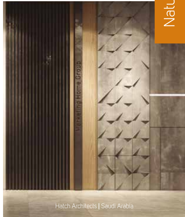
Hatch Architects | Saudi Arabia