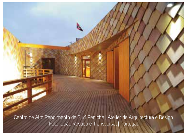
Centro de Alto Rendimento de Surf Peniche | Atelier de Arquitectura e Design Foto: João Rosado e Transversal | Portugal